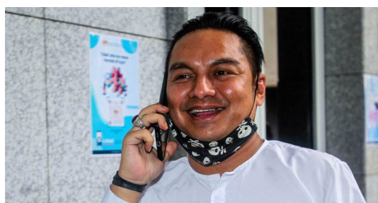
MUTAKHIR Boy Iman didenda RM5,000