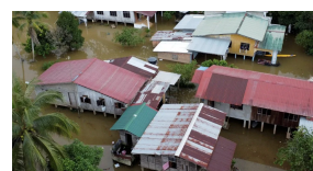
Infobencana 2.0 lebih inovatif