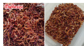
Rahsia Buat Sambal Bilis Rangup, Makan Dengan Apa Saja Pun Sedap!