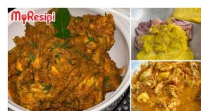
Lebih 50K Shares, Wanita Ini Kongsi Cara Buat Rendang Ayam Style Orang Perak