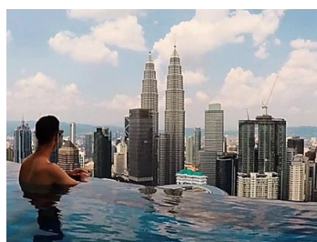
Essential Guide To Personal Finance For Malays