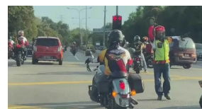
Polis cari 'marshal' berlagak polis trafik