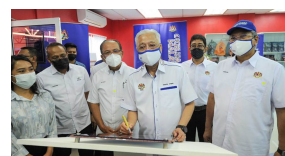
800,000 usahawan kecil dijangka beralih kepada pendigitalan