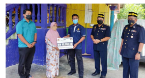
560 pegawai, anggota JPJ dijangkiti Covid-19 sepanjang pandemik