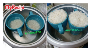
Cara Masak Nasi Untuk Sorang Makan, Baru Tak Membazir & Nasi Tak Berkerak