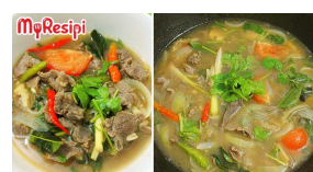
Resipi Sup Daging Ori Thai. Kena Letak Satu Bahan Ini Baru Rasa Lagi 'Kick'