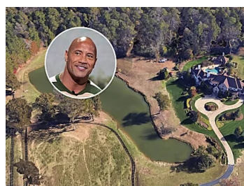
Dwayne 'The Rock' Johnson Buys Georgia Farm - The Home Was...