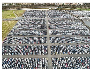
Kuala Lumpur: Liquidation Of Unsold 2020 SUVs. Prices M...