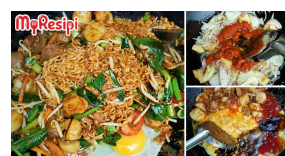
Resipi Maggi Goreng Special, Masak Sampai Maggi Berasap Baru Lagi Padu