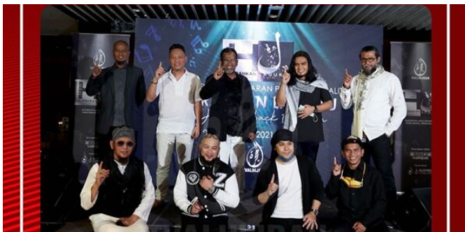
Hijrahkan Laguku, 8 artis bersaing rebut gelaran juara