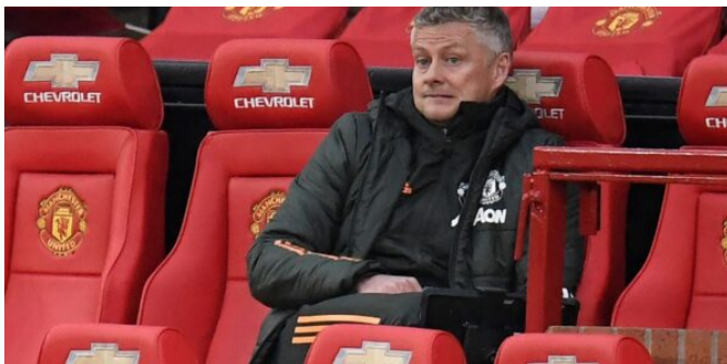
Bila Ole akan dipecat?