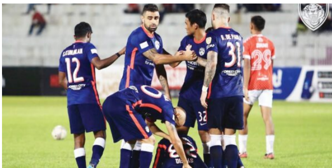
Kedah ancaman besar Harimau Selatan