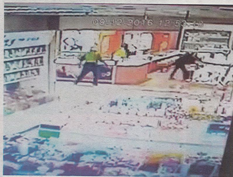
RAKAMAN CCTV menunjukkan sekumpulan lelaki sedang merompak sebuah kedai emas di Plaza OUG.

"Dalam masa yang sama, suspek lain bertindak memecahkan cermin pameran barang kemas menggunakan tukul dan parang sebelum melarikan 21 dulang ba-