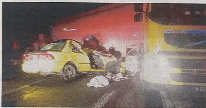
KEADAAN kereta dipandu Muhammad Iskandar yang terperosok di bawah treler tangki minyak selepas terbabit dalam kemalangan di Jalan Jelor-Bachok, Pasir Puteh semalam.

PASIR PUTEH - Pasukan Bomba dan Penyelamat Pasir Puteh mengambil masa kira-kira 52 minit untuk mengeluarkan mayat seorang pemuda yang tersepit di dalam kereta yang merempuh sebuah treler tangki minyak dalam satu kemalangan di Jalan Jelor-Bachok dekat sini semalam.