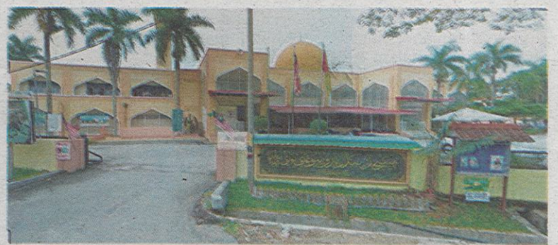
Di Masjid Bandar Baru Sungai Buloh inilah sembilan anggota sindiket mengutip derma warga Thailand ditahan bersama senjata tiruan ketika sedang tidur semalam.

mua suspek memasuki negara ini pada akhir bulan lalu menggunakan visa pelancong dan dipercayai menjalankan sindiket mengutip derma tanpa permit di sekitar Selangor termasuk Ampang Jaya, Petaling Jaya dan Bangi untuk pembinaan sebuah pusat tahfiz.